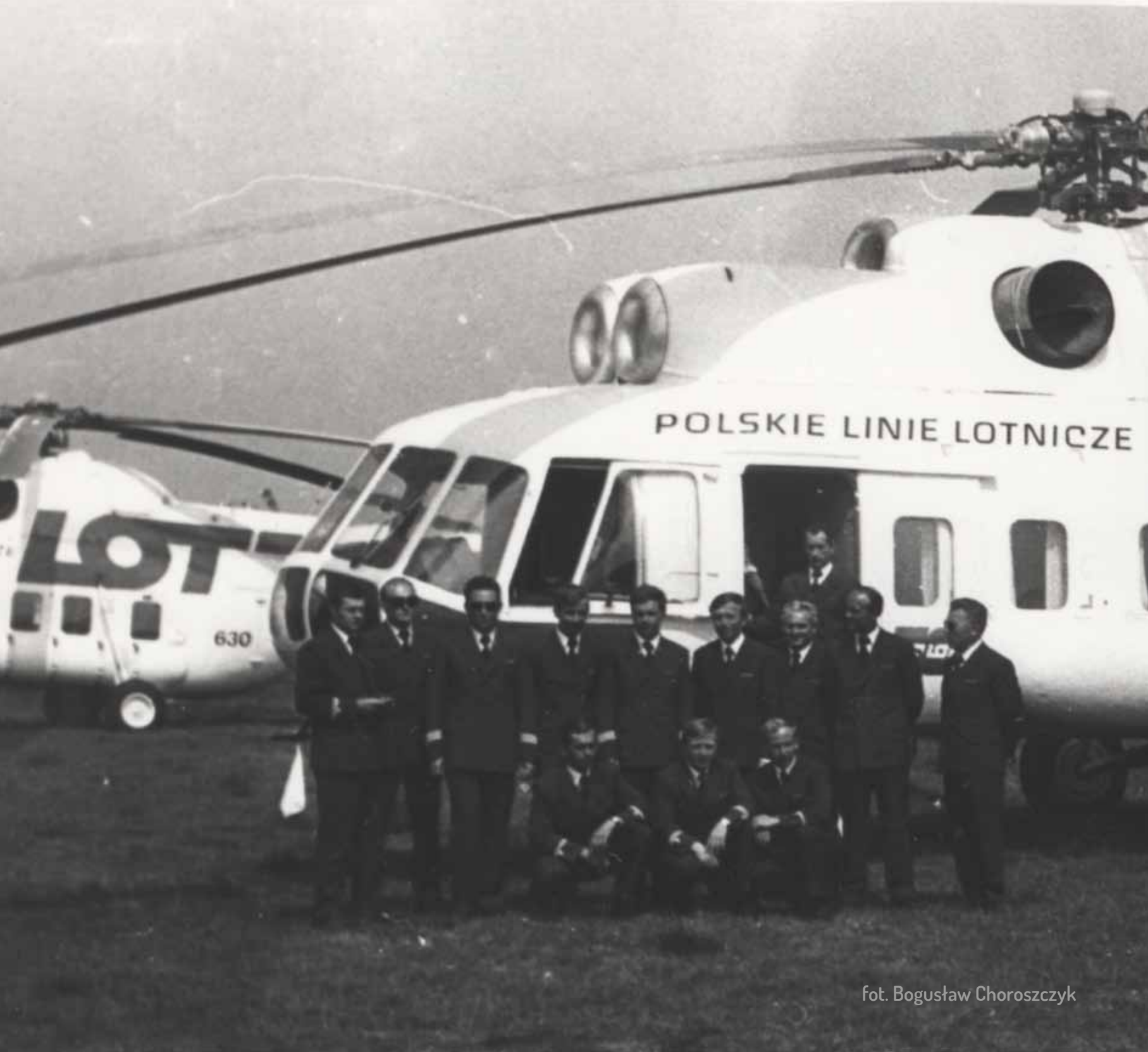
fot. Bogusław Choroszczyk